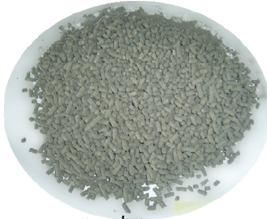
เม็ดปุยที่ได้จากการอัด

ขายดีที่สุด ! ประหยัดเงิน ลดแรงงานและระยะเวลา คุ้มค่า คื่นทุนไว ทำอาหารสัตว์ได้อีกด้วย รับประกัน 1 ปีเต็ม